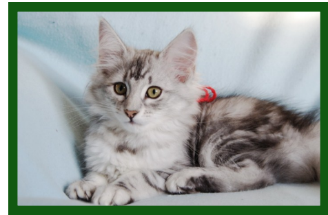
Black silver tabby