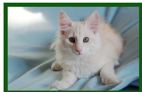
Red silver tabby